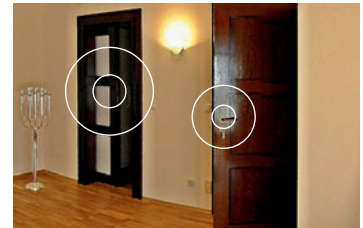
pulsierende HotSpots zur „point-and-klick“-Navigation

Diese HotSpots sind animierte Grafiken, die im Bild z.B. bei einer Tür (siehe Grafik rechts) platziert werden können, und dem User signalisieren, dass hier etwas anzuklicken ist. Sobald der User mit der Maus auf diesen HotSpot klickt, erscheint ein Text, der individuell benannt werden kann – z.B. „weiter“ – dann gelangt man an den nächsten Standort bzw. in das nächste Panorama.